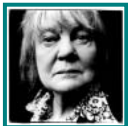
Iris MURDOCH (1919 -)

Filósofa e romancista francesa. A sua obra mais conhecida é O Segundo Sexo , uma das primeiras obras de filosofia feminista realmente influentes. Aí discutiu e argumentou contra as razões que estão na base da opressão das mulheres. Destacou-se também, juntamente com o filósofo Jean-Paul Sartre, com quem viveu, na defesa de uma filosofia existencialista.