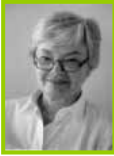
Judith Jarvis THOMSON (1929 -)

Filósofa americana. As suas áreas são a ética e a metafísica. No domínio da ética a sua importante obra O Reino dos Direitos , procura discutir o que é ter um direito e quais os direitos que temos. Na metafísica ocupa-se principalmente dos problemas da causalidade e da identidade através do tempo. Tem também vários artigos largamente discutidos sobre problemas de ética aplicada, nomeadamente sobre o aborto.