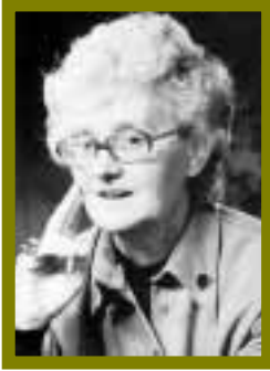
Mary MIDGLEY (1919- )

Filósofa britânica, foi professora na Universidade de Newcastle on Tyne. As suas principais obras filosóficas incidem sobre problemas da área da ética, evolução e cultura humana. Em termos de impacto junto do grande público, destacam-se as suas obras acerca do modo como os animais são tratados pelos seres humanos, nomeadamente Beast and Man e Animals and Why They Matter . Mary Midgley é vegetariana.