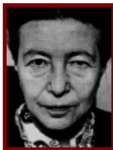
Simone de BEAUVOIR (1908 -1986)