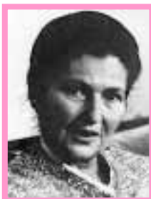
Simone WEIL (1909-1943)

Filósofa judia nascida na Alemanha, acabou por emigrar para os Estados Unidos na altura da 2ª Guerra Mundial. Os seus livros, como O Sistema Totalitário , tratam de problemas de filosofia política, nomeadamente os problemas relacionados com o exercício do poder e os fenómenos totalitários, numa abordagem inspirada no existencialismo alemão.