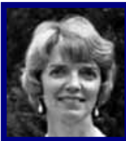
Patricia CHURCHLAND (1943 - )

A baronesa inglesa Mary Warnock dedicou-se sobretudo à ética existencialista, à bioética e ao ensino, tendo sido professora na Universidade de Oxford. Mais recentemente obras como Imagination (1976) e também Memory (1987) revelam o seu interesse pela Filosofia da Mente.