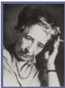
Hannah ARENDT (1906-1975)

Martha Nussbaum é uma das mais conhecidas filósofas americanas. Ligada a algumas das mais prestigiadas universidades de diferentes países mundo e a organizações de investigação internacionais, as suas áreas principais são a filosofia do direito e a ética. As conferências que dá pelos quatro cantos do mundo são invulgarmente concorridas. Entre os seus livros encontra-se o premiado Cultivating Humanity .